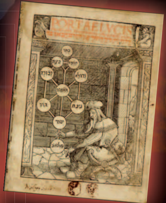
Der kabbalistische Lebensbaum

Historisch taucht der Begriff Rosenkreuzer Anfang des 17. Jahrhunderts auf, in einer Schrift, der sog. Fama Fraternitatis , mit der erstmals eine breite Öffentlichkeit von den Rosenkreuzern erfahren hat. Diese Schrift wurde jedoch viel zu wörtlich genommen, denn in der Fama Fraternitatis ist eine allegorische Darstellung des traditionellen Einweihungsweges der Rosenkreuzer verborgen. So stehen die Buchstaben C.R. nicht für eine vermeintlich historische Gestalt als angeblichen Gründer des Ordens. Die Buchstaben C.R. waren bereits im alten Ägypten in Gebrauch und sind bis heute Symbol für die Veredelung des Geistes. Dies zeigt, dass es neben der offiziellen Religion auch bei uns im Westen eine überlieferte spirituelle Tradition gibt. Doch erst mit dem Erscheinen der historischen Rosenkreuzer-Manifeste