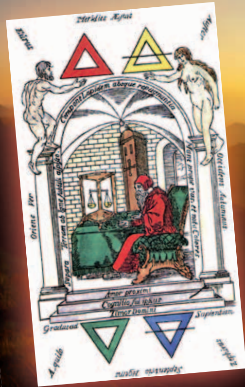
Symbolische Darstellung der vier Elemente