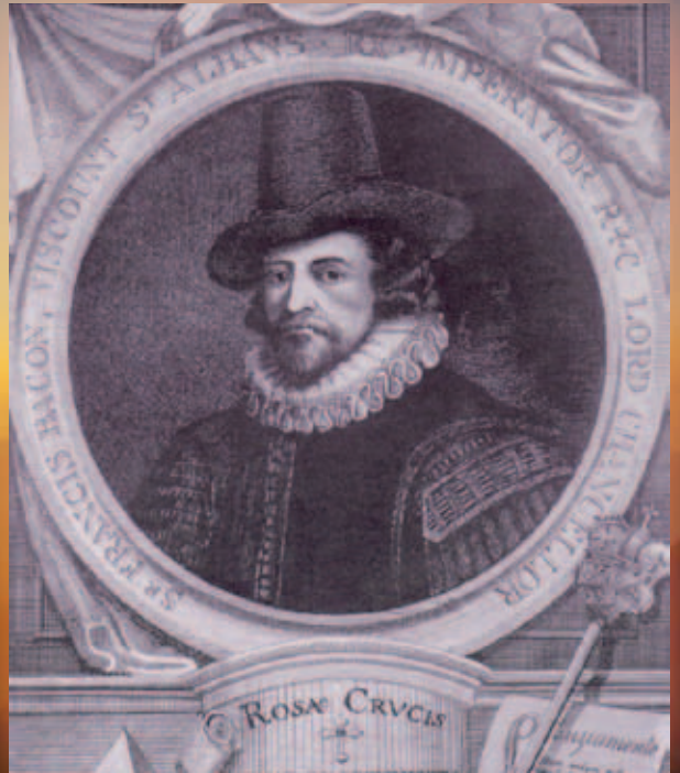
Sir Francis Bacon

„ ... und zeigt dem Menschen Möglichkeiten auf, die Geheim- nisse der Schöpfung und seines inneren Wesens zu entdecken.